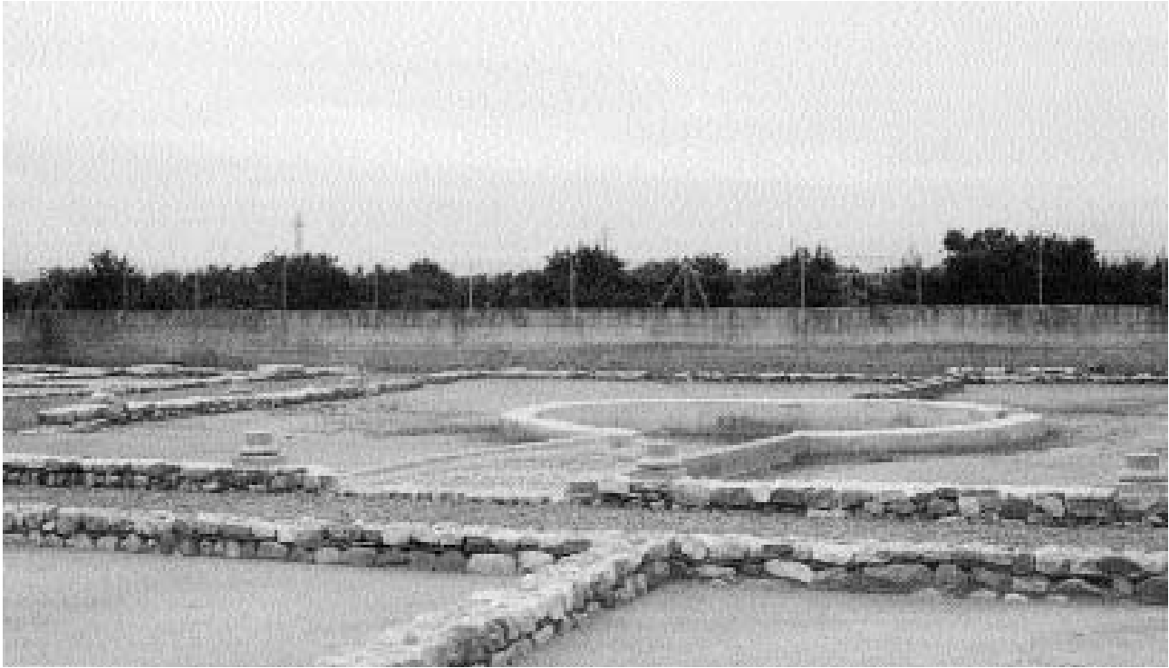
1. Vista general de l'estat final de les obres de consolidació i restauració, corresponents a la part del peristil.