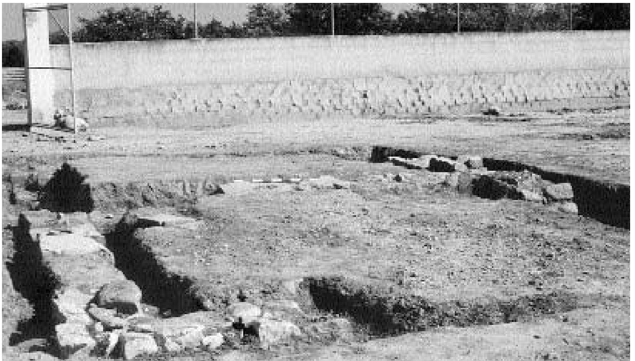
2. Vista de conjunt del nou recinte tal i com va aparèixer a la neteja del jaciment.