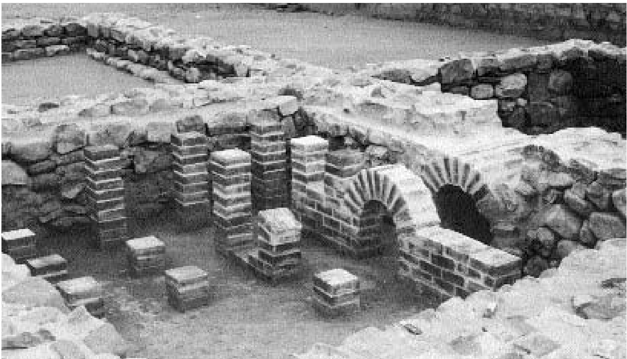
2. Reconstrucció de les estructures del praefurni .