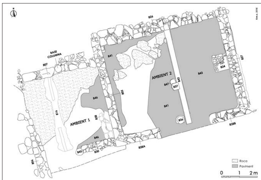
Fig. 2. Planta general del Sondeig 8 (Autora: Lledó Molinos Carceller).

que aquestes habitacions pertanyen a una primera hipotètica fase edilícia d'època juli-clàudia que podria estar relacionada amb la construcció del fòrum i la reforma de tot aquest sector de la ciutat.