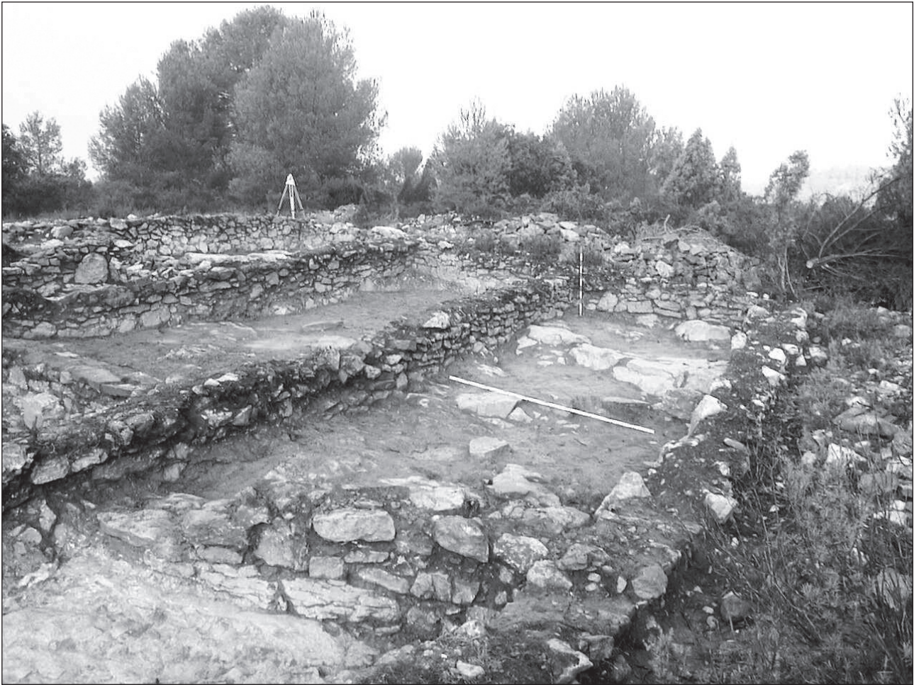
Figura 2. "Edifici C", vist des del sud.

La estança C6 la considerem com a vestíbul d'accés a la unitat principal de la casa que seria la estança C3; amb les restes de la llar i un enterrament en urna sota el seu paviment com a indicis més evidents de la centralitat d'aquesta estança. Queda clar aleshores, que en la nostra hipòtesi les entrades a les dependències d'aquest edifici es farien pel la vessant sud-oest, just la que queda per excavar.