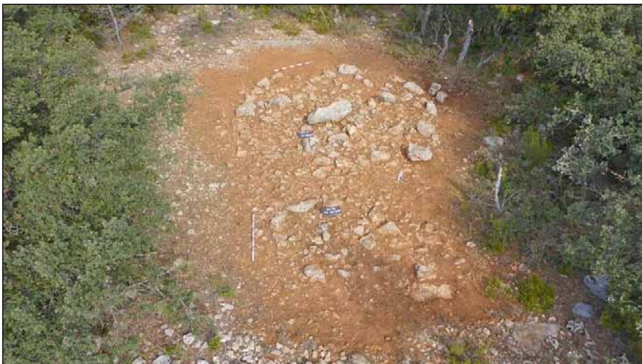
Figura 2. Agrupació tumular

territorial que s'esgotarà al final d'aquesta última centúria. En aquest territori, la foia de Zucaina es configura com un ampli espai funerari on es realitzen els rites vinculats a l'enterrament d'un poblament que encara està per documentar amb tota la seva extensió i articulació i que pretenem documentar en alguns punts de la foia i també més enllà dels seus límits en properes campanyes d'excavació.