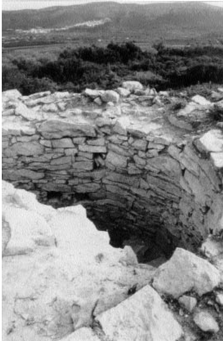
1. Vista parcial de l'alçat de l'interior de la torre.