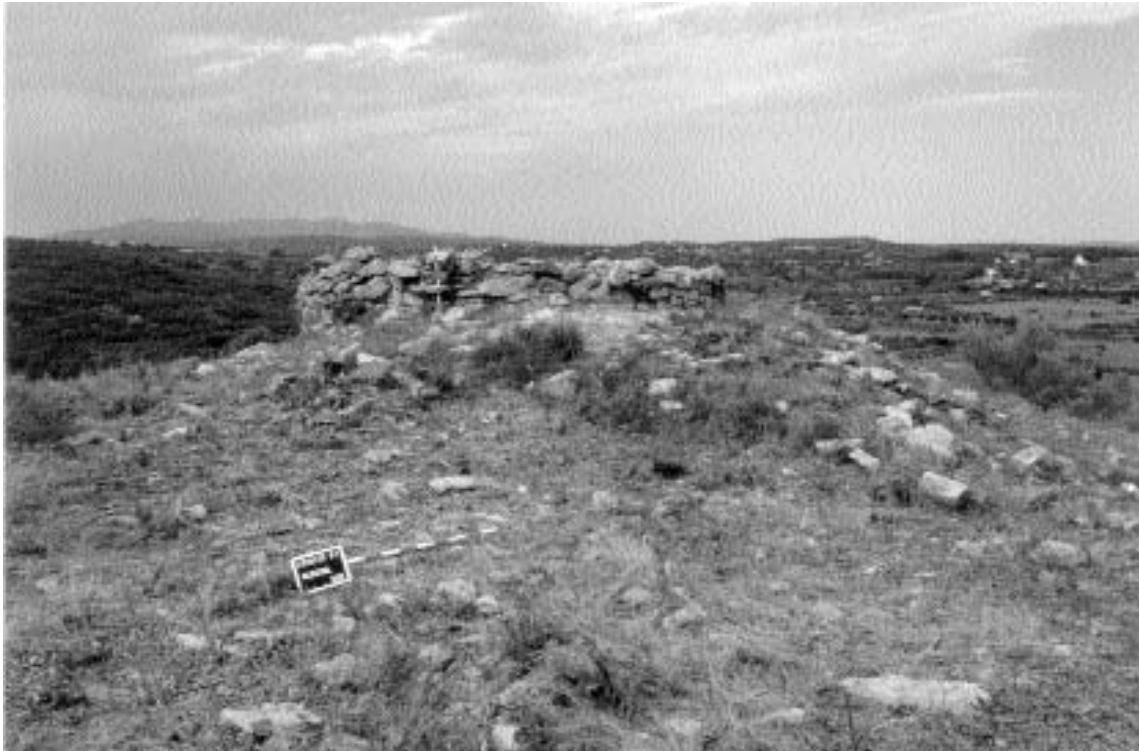
1. Panoràmica de la torre.