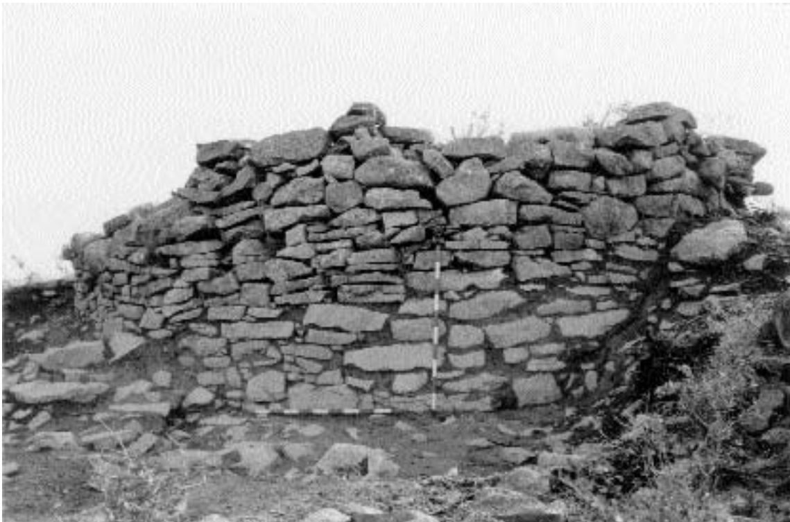
2. Alçat exterior de la torre.